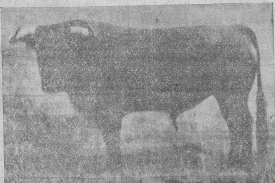
Número 12, "Guerrero", negro