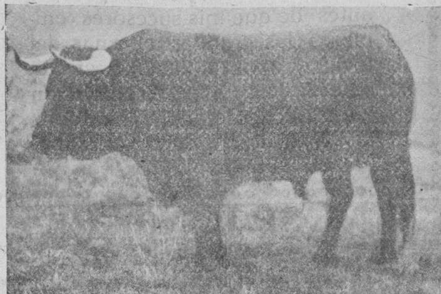
Número 22, "Secretario", negro