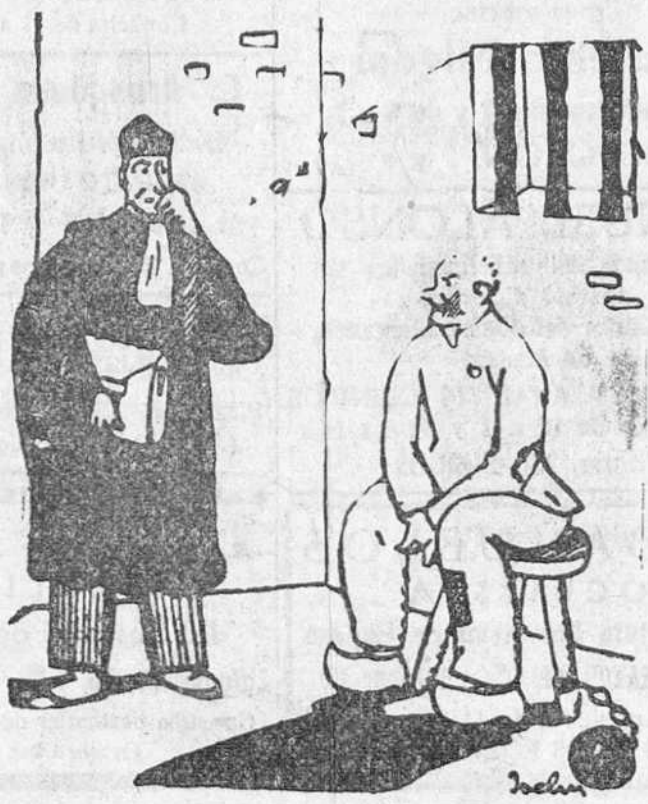
—Enhorabuena, amigo mío. Ha sido un triunfo. El fiscal ha estado terrible. Le pedía a V. tres penas de muerte. —¿Y a qué me han condenado? —A una nada más.

Es ahora cuando la antigua Fábrica Nacional de Armas ha logrado remozar la remota fama del temple del acero toledano, de corte suave y firme, con un objeto moderno que vuelve a hacer famoso el acero toledano: es la hoja de afeitar «TOLEDO». Ensáyela. Por economía. Por comodidad. Por patriotismo. Es un gran triunfo de la industria nacional.