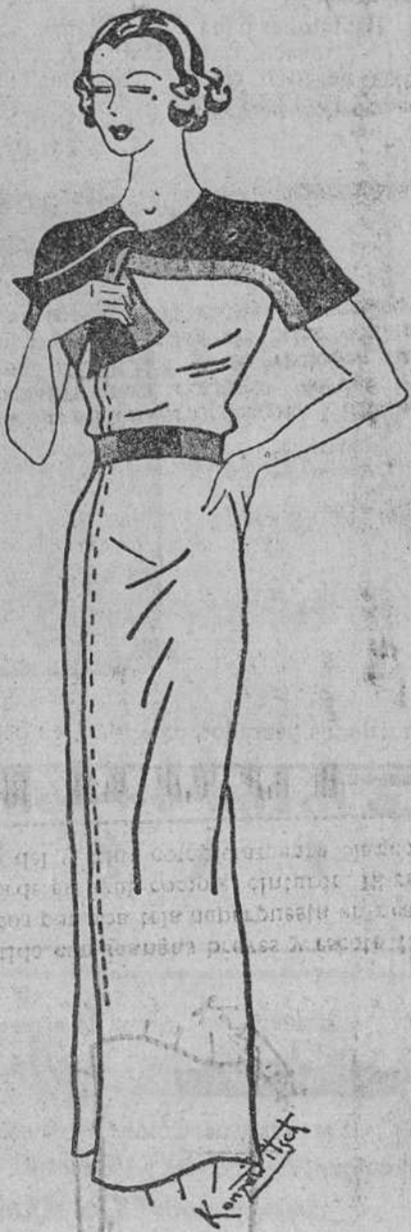
Vestido con mangas breves y escote formado por una tela superpuesta en negro y borde en azul, como el cinturón. El resto del vestido completamente blanco.