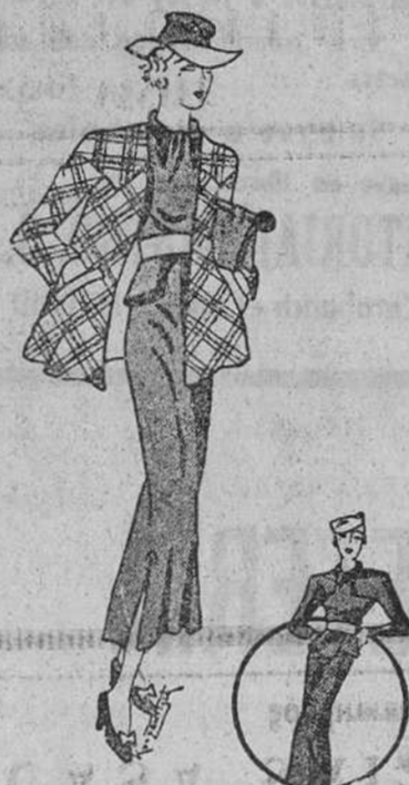
Vestido para el día en lanilla azul con cinturón de cuero blanco y chaqueta de lana con colores lineales.

...los vestidos de noche de crepón, con estampados de tulipas blancos y rosa, sobre un fondo oscuro. Las mangas son anchas.