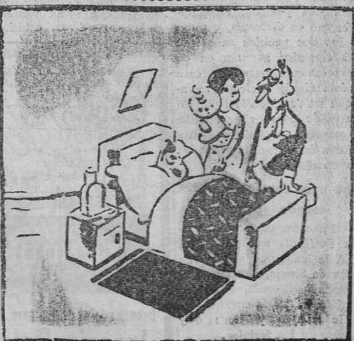
LA VISITA DEL MEDICO

—¿Le ha dado usted la medicina que le receté? —Sí. Se ha tomado 24 cucharadas en dos horas. —Pero si yo dije dos cucharadas en 24 horas.