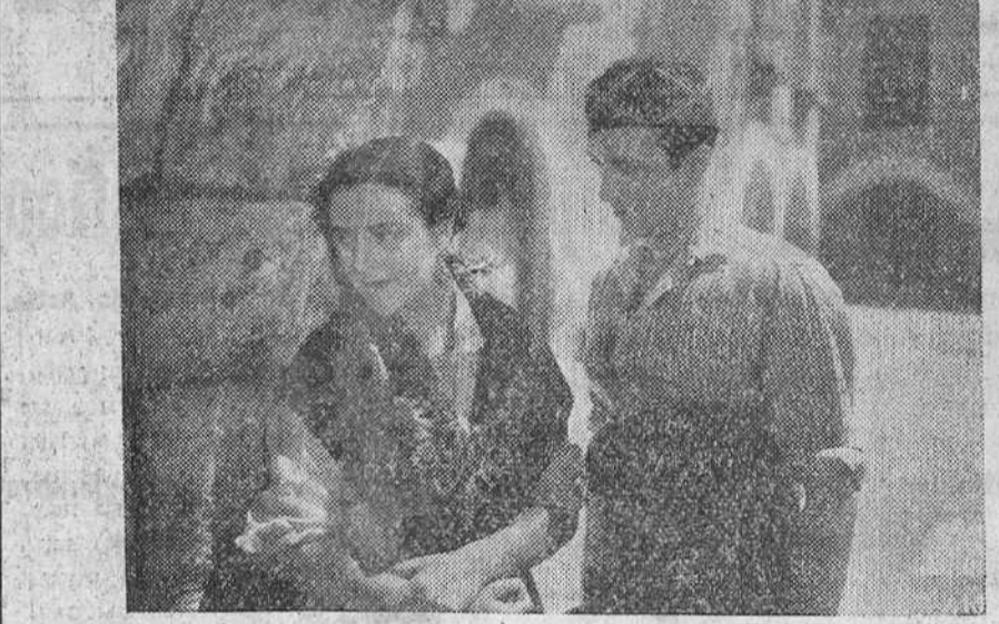
Imperio Argentina y Juan de Orduña en la superproducción nacional de "Cifesa", "NOBLEZA BATERRA", que próximamente será presentada en nuestra ciudad.

La Solana de la Plata Venta económica de hortalizas en la finca Camino de la Plata