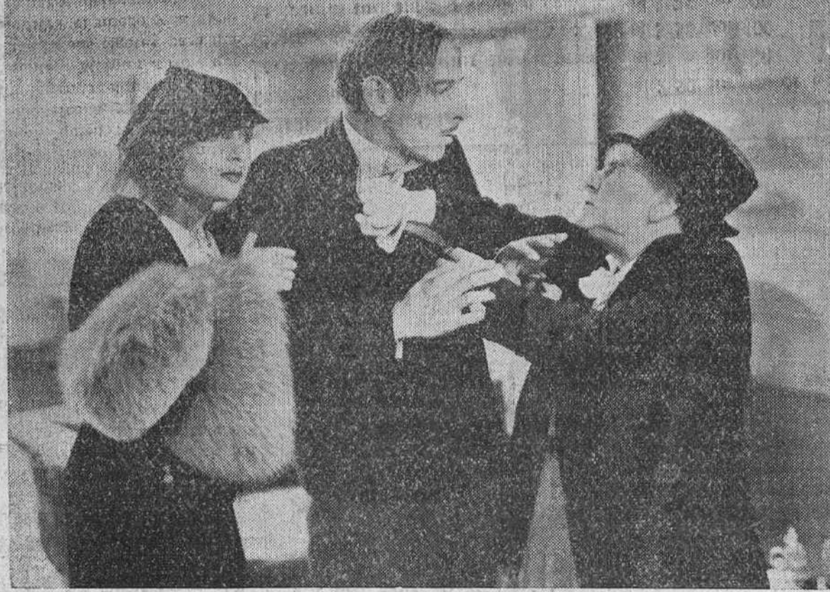
Una escena de la interesante producción americana de "Cifesa", "ANGEL DEL ARROYO", protagonizada por May Robson y Carole Lombard.