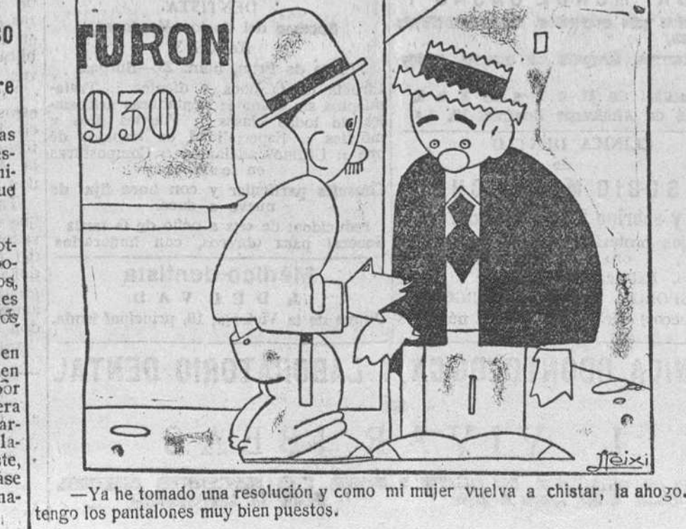
—Ya he tomado una resolución y como mi mujer vuelva a chistar, la ahogo. Yo tengo los pantalones muy bien puestos.

Mañana marchará a Santander el jefe del Gobierno, y regresará a Madrid el jueves, para asistir al Consejo que se celebrará ese día. Los nuevos ministros jurarán sus cargos en Santander.