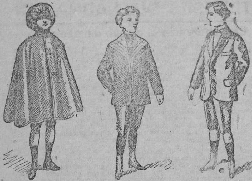
Capita impermeable a 8, 10 y 15 pesetas Trajecitos para niños diversidad de modelos, de 30 pesetas

Gran casa de tejidos, pañería y confecciones de caballero, señora y niños