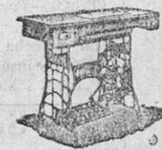
Máquina secreter, de lanzadera vibrante, a 325 pesetas. De bobina central 395 pts.