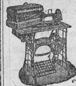
Máquina doméstica, cose hacia adelante y hacia atrás, 250 pesetas.

La mejor y más barata de las máquinas de coser y máquinas de hacer medias y calnetines, es sin duda alguna la marca STOEWER (alemanas).