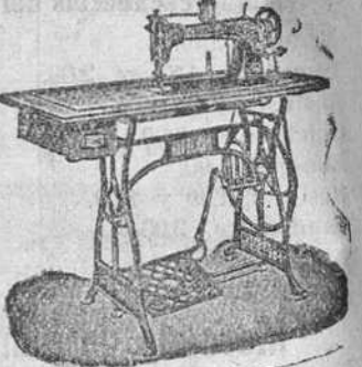
Máquina industrial, fuerte y silenciosa a 400 pesetas. I. o. bin central