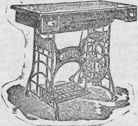
Máquina secreter, de lanzadera vibrante, 325 pesetas; de bobina central, 395.

La máquina de fama mundial y la más barata, por no tener esta casa presupuesto de gastos. Enseñanza a coser y bordar y entrega de patrones para confeccionar ropas de caballero, señora y niños.