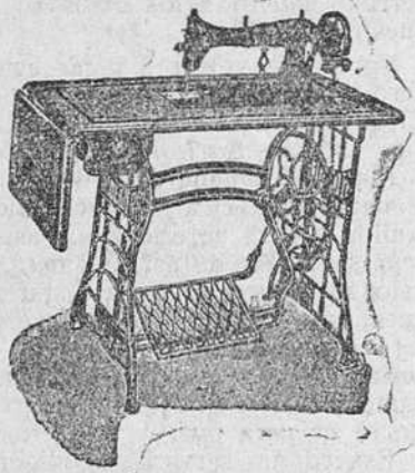
Máquina doméstica, de extensión, 365 pesetas.