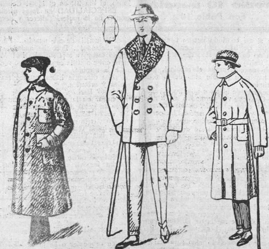
Peluzas paño, cuello rizo Gabardinas a 4, 5, 6, 7 y 8 pesetas Guardapié de caballero a 18, 21, 25, 30, 40, 50 y 60 pesetas Impermeables de 2 a 0

La casa que más barato vende y más surtido presenta