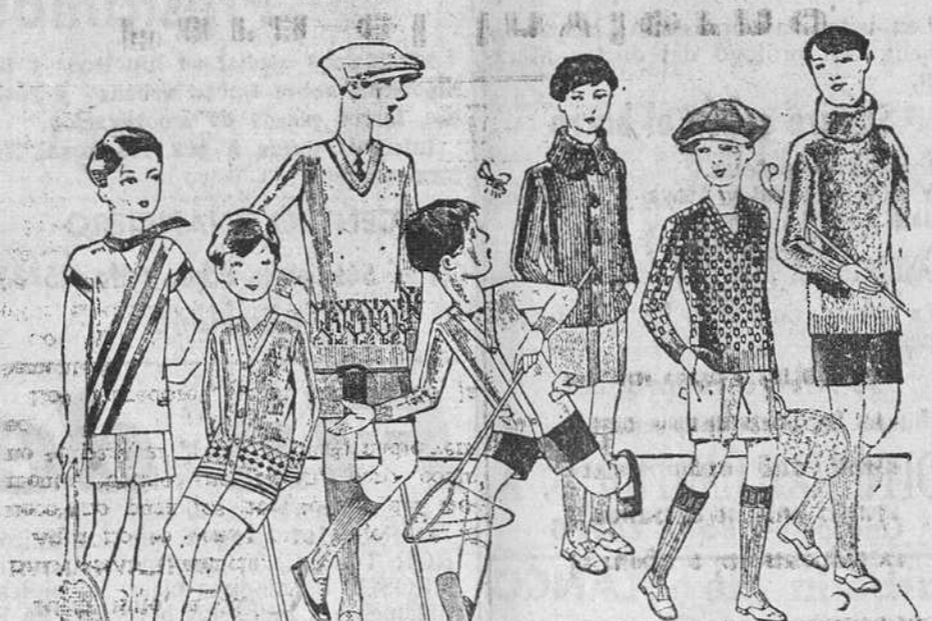
Jerseys, punto, para niño, diversidad de dibujos y colores A 4, 5, 6, 7, 8 y 10 pesetas