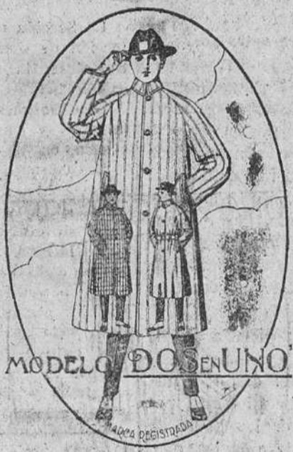
MODELO DO EN UNO

Gabardinas, diversidad de gustos y coloridos, a 40, 50, 69, 70, 86, 90 y 100 pts. Trajes paño, propaganda de la casa, buena confección, a 50 pesetas Sección de medida - Corte perfecto CALZADOS SEGARRA, para caballero, señora y niño