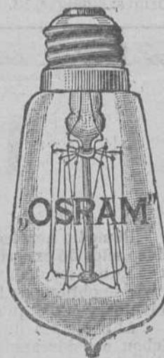
Toda lámpara «Osram» legítima lleva la marca «OSRAM» grabada en el cristal.

LEON ORNSTEIN - Madrid - Mariana Pineda, 5