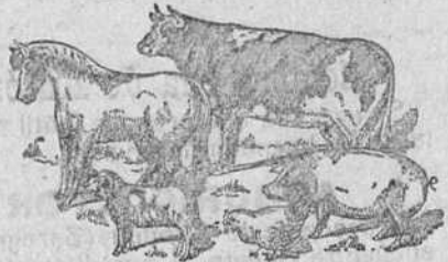
Tomando El Engorde Castellano de Liras comen con gusto, aumenta el número de glóbulos de la sangre, hacen buenas digestiones, pesan más.

Los polverosos reconstituyentes del sistema óseo (huesos) y del organismo en general, como son: compuestos hidrocarburos, ácido fosforico, hierro asimilable, fosfatos puros, depurativos, sal sódica y azufre, estimulantes, aperiivos vegetales que hacen al ganado que coma con gusto, etc., etc.