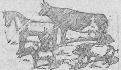
Antes de tomar El Engorde Castellano de Liras , hay ganado anémico, sin apetito, hace malas digestiones, enferman.

Las gallinas ponen doble número de huevos y pierden el vicio de comerse los, les evita esa enfermedad que tanto las persigue y ponen dos meses antes las jóvenes. Como en la composición de este preparado entran elementos que forzosamente tienen que resultar para este objeto y dosificados como van escrupulosamente.