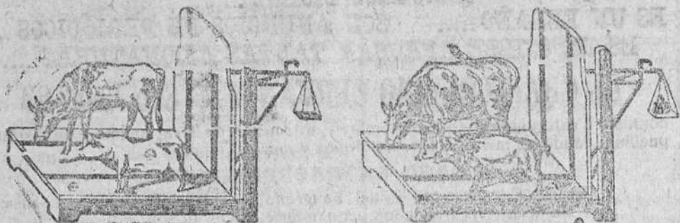
Demostración del resultado de este preparado:

Las gallinas ponen doble número de huevos y pierden el vicio de comerse los, las evita esa enfermedad que tanto las persigue y ponen dos meses antes las jóvenes. Como en la composición de este preparado entran elementos que forzosamente tienen que resultar para este objeto y dosificados como van escrupulosamente.