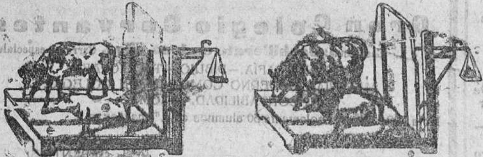
Demstración del resultado de este preparado:

Las gallinas ponen doble número de huevos y pierden el vicio de comérselos, les evita esa enfermedad que tanto las persigue y ponen dos meses antes las jóvenes. Como en la composición de este preparado entran elementos que forzosamente tienen que resultar para este objeto y dosificados como van escrupulosamente.