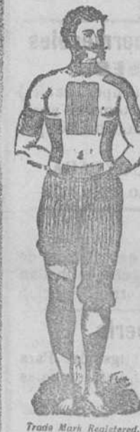
Trade Mark Registered.

CURAN REUMATISMO, RESFRÍADOS, DOLOR DE RIÑONES, DOLOR DE ESPALDA, DOLOR DE PULMONES, LUMBAGO, CIÁTICA, CONTUSIONES, ETC.