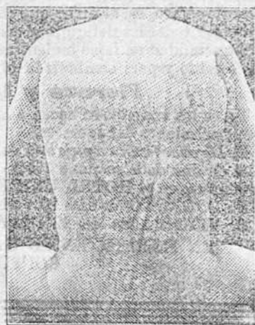
Después de 15 días de tratamiento