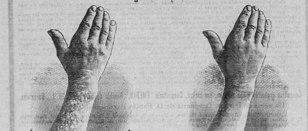
Antes de la curación. Después de 15 días de tratamiento.

Descubrimiento sensacional. Curación de las enfermedades de la piel y también de las llagas de las piernas