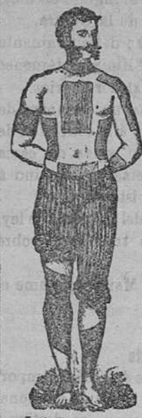
Trade Mark Registered.

Para convalecientes y personas débiles es el mejor tónico y nutritivo. Inapetencia, malas digestiones, anemia, raquitismo, etc. Farmacia: León 13.—Laboratorio, Granada, 5, Madrid.