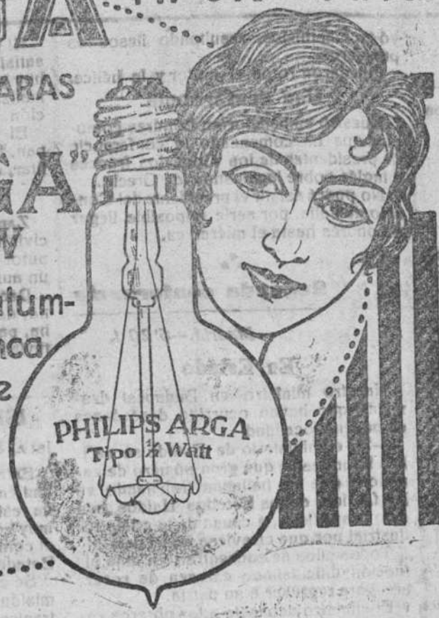
PHILIPS ARGÁ Tipo 1/2 Watt

Es inútil ocultar la verdad. Las modernas lámparas PHILIPS ARGÁ sustituirán en breve plazo las de filamento metálico, que ya no convienen.