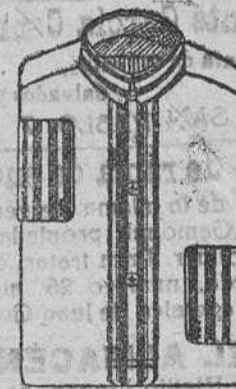
Camisas percal, á 8, 9 y 10 pesetas.

Depósito de las sandalias «Paco», con piso de goma, propias para invierno, y de las máquinas de escribir NOISELESS, completamente silenciosa.