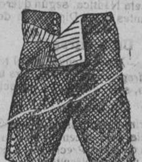
Pantalones paño y pana, à 4, 5, 6, 7, 8, 9 y 10 pts.

Depósito de las sandalias «Paco», con piso de goma, propias para invierno, y de las máquinas de escribir NOISELESS, completamente silenciosas.