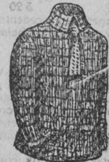
Jerseys lana, à 15, 20, 25 y 30 pts.