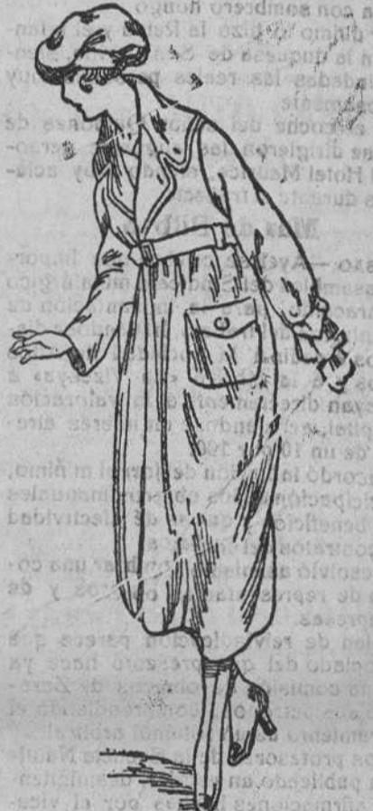
Abrigos para señora, à 15, 20, 30, 40 y 50 pesetas.