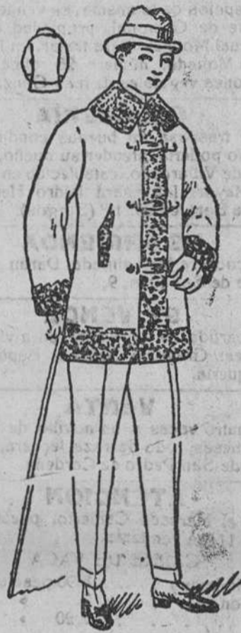
Pelizas carter, con rizo, à 40, 50 y 60 pesetas.