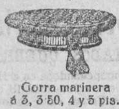
Gorra marinera á 3, 3'50, 4 y 5 pias.