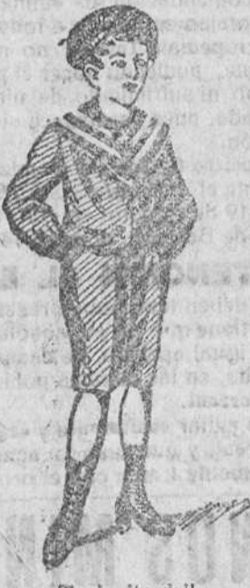
Trajeito drill á 9, 10, 12 y 15 pias. El mismo, en vicuña, á 15, 20, 25 y 30