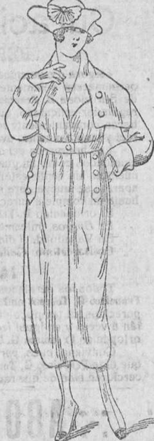
Gabardinas de señora y ca- ballero á 110, 115, 125, 135 y 150 pesetas

Enterizos propios para mecá á 9, 10, 12 y 15 pias. nicos y motoristas á 15, 18, 22, 25 y 30 pesetas El mismo, en vicuña, á 15, 20, 25 y 30