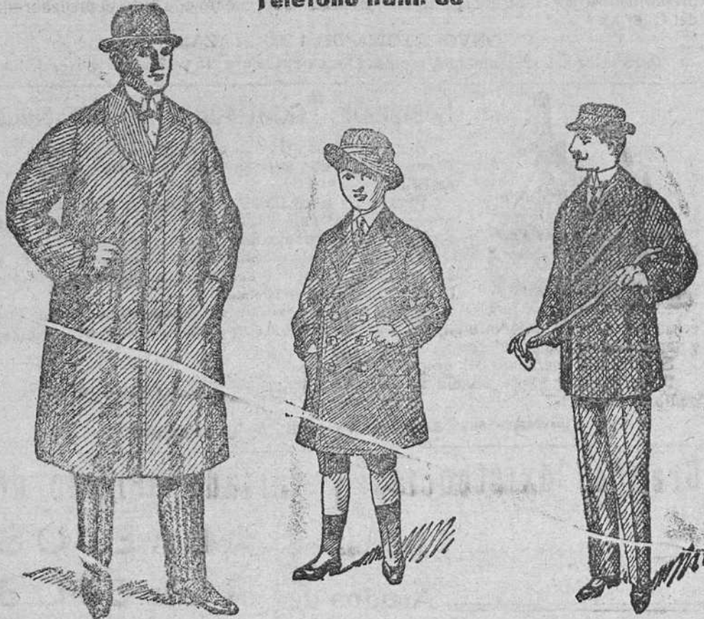
Gabanes de caballero y jóvenes, desde 40 á 125 pesetas. Siempre últimas novedades.

Siempre á precios económicos -- Precio fijo Teléfono núm. 88