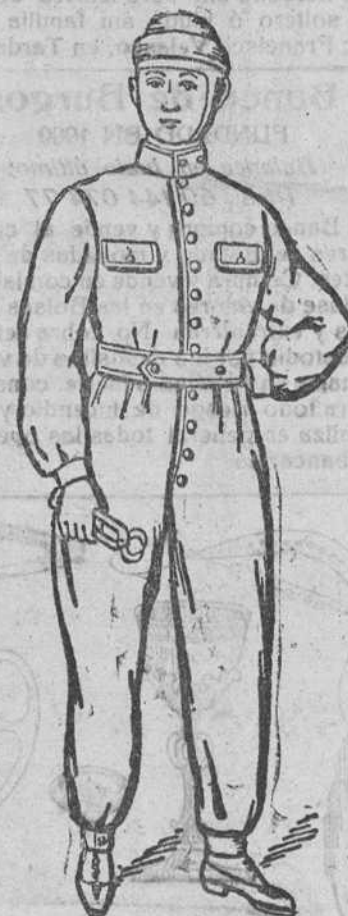
Enterizos para mecánicos y motoristas á 15, 20, 23, 25 y 30.

Depósito de las sandalias «Paco», con piso de goma, propias para invierno, y de las máquinas de escribir NOISELESS, completamente silenciosas.