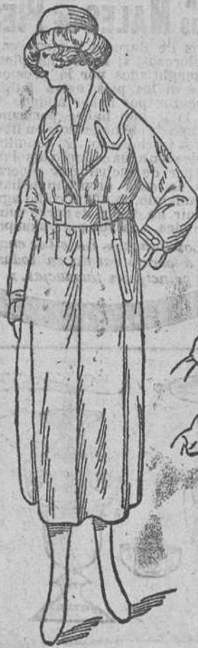
Gabardinas señora y niñas á 100, 110, 120, 130, 140 y 150 pesetas.