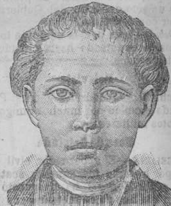
Después de 15 días de tratamiento

Descubrimientos sensacional. Curación de las enfermedades de la piel y también de las llagas de las piernas