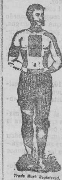
Trade Mark Registered.

CURAN REUMATISMO, RES-FRIADOS, DOLOR DE RINONES, DOLOR DE ESPALDA, DOLOR DE PULMONES, LUMBAGO, CIÁTICA, CONTUSIONES, ETC.