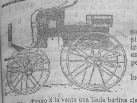
NOTA.—Tengo á la venta una linda berlina clavens y un landé de dos capotas, seminuevos en precios bastante económicos.