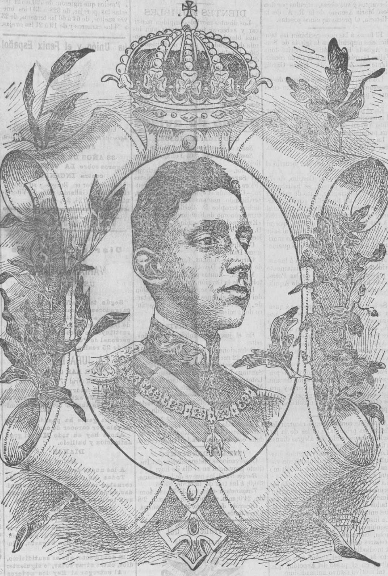
S. M. el Rey Don Alfonso XIII.

Ceremonial La Gaceta publica el ceremonial que se observará en la solemnidad del juramento que, conforme al art. 45 de la Constitución de la monarquía, ha de prestar ante las Cortes S. M. el Rey don Alfonso XIII. Dice así: 1.º SS. MM. el Rey y la Reina Regente, acompañados de la Real Familia, saldrán de Palacio a la una y media de la tarde, dirigiéndose por la plaza de las Armas, saliendo por la puerta central de la verja, plaza de la Armería, calle de Bailén, calle Mayor, Puerta del Sol, Carrera de San Jerónimo al Palacio del Congreso. 2.º Veintiún cañonazos anunciarán la salida de SS. MM. y Real Familia de Palacio. 3.º Las tropas de la guarnición ocuparán la carrera. 4.º SS. MM. y Real Familia serán recibidos y despedidos en el Palacio del Congreso por comisiones de ambos cuerpos Colegisladores en la forma acostumbrada. 5.º Una vez en presencia de las Cortes, S. M. el Rey pondrá su mano derecha sobre los Santos Evangelios y jurará por sí mismo el siguiente juramento: «Juro por Dios, sobre los Santos Evangelios, guardar la Constitución y las leyes. Si así lo hiciera, Dios me lo pague, y si no, me lo demande.»