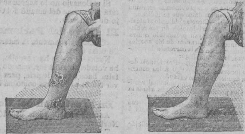
Antes de la curación A los 15 días de tratamiento