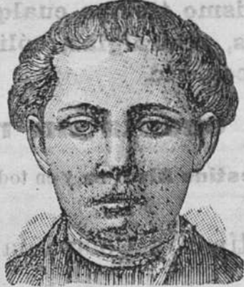
A los 15 días de tratamiento