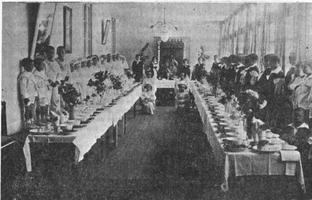
El día del Sagrado Corazón de Jesús fué el más feliz para estos niños de la Residencia que, por primera vez, albergaron en sus pechos al Divino Niño

La escasa fuerza de resistencia de la envoltura terrestre explicaría la formación de volcanes sobre las costas marinas. A la presión del aire se añade el peso de la columna de agua y la suma de estas dos presiones tiene por efecto elevar a lo alto en los puntos de menor resistencia las sustancias ardientes aprisionadas en las regiones profundas.