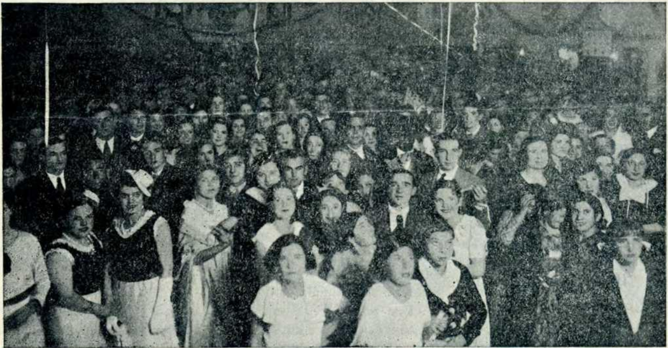
BAILE DE PIÑATA: Un aspecto de la sala.