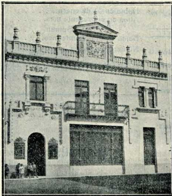
Edificio de su propiedad en Arévalo

SE FACILITAN GRATUITAMENTE HUCHAS PARA EL AHORRO A DOMICILIO