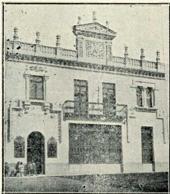
Edificio de su propiedad en Arévalo

SE FACILITAN GRATUITAMENTE HUCHAS PARA EL AHORRO A DOMICILIO