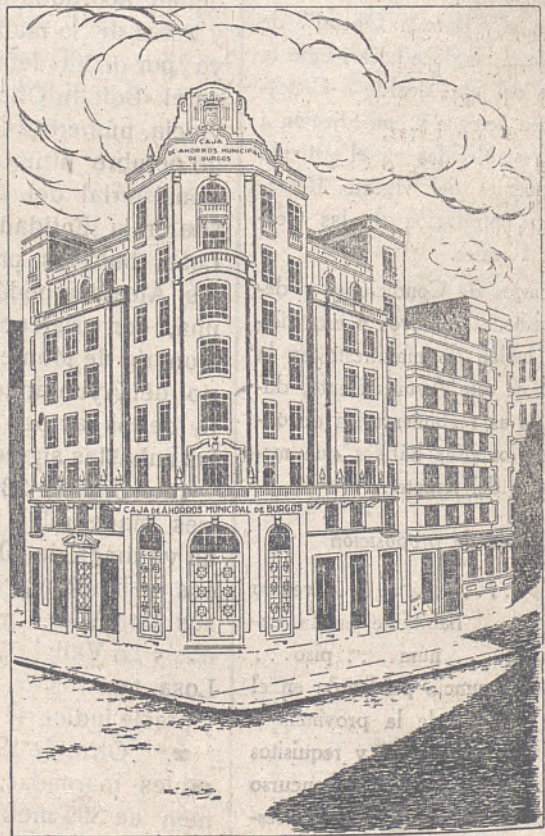
Agencia de la Caja de Ahorros Municipal, en Miranda de Ebro

Créditos especiales para adquisición de tierras, maquinaria agrícola y mejoras de la agricultura al 3,75 % de interés anual