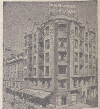
SUCURSAL - Espolón, 32 (ENTRADA POR EL HONDILLO)