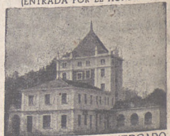
SUCURSAL DEL MERCADO DE GANADOS DE S. AMARO