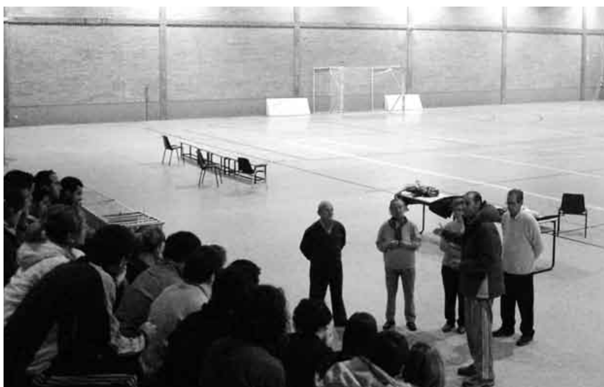
Clase de Juegos y Deportes Populares (Facultad de Ciencias de la Actividad Física y del Deporte)