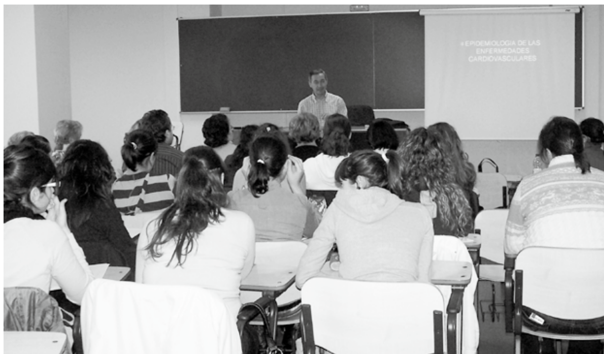
Prevención de Enfermedades Cardiovasculares (Campus de Ponferrada).