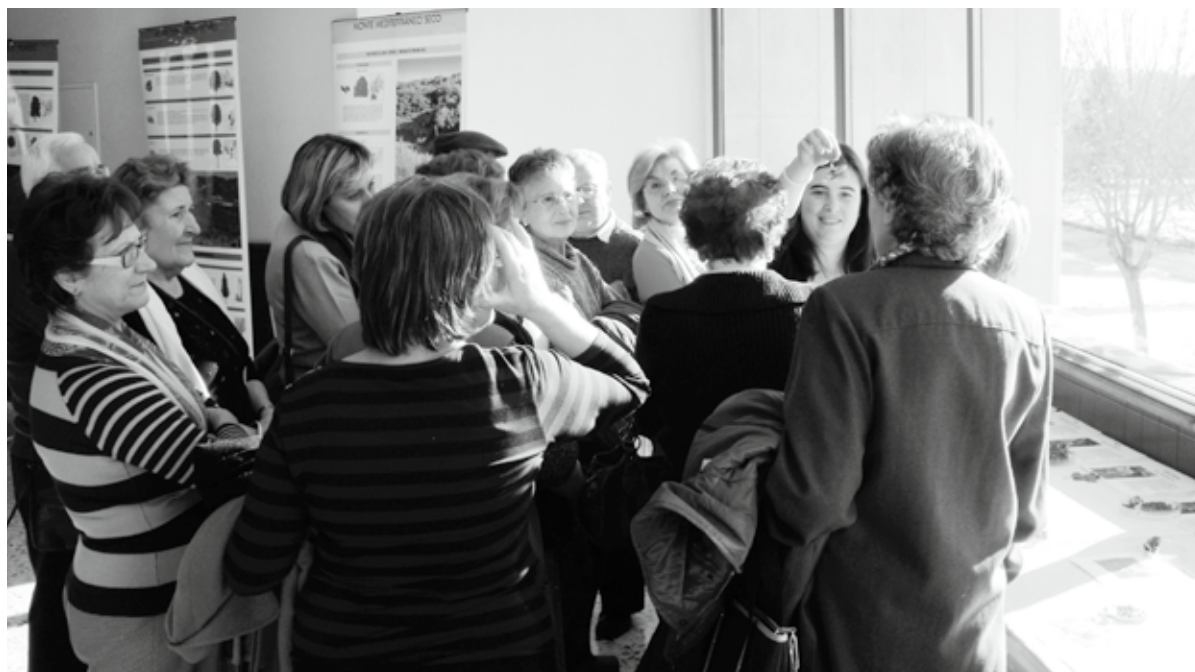
Visita a la Exposición Fotográfica "Las semillas de los bosques del futuro" (Facultad de Ciencias Biológicas y Ambientales).