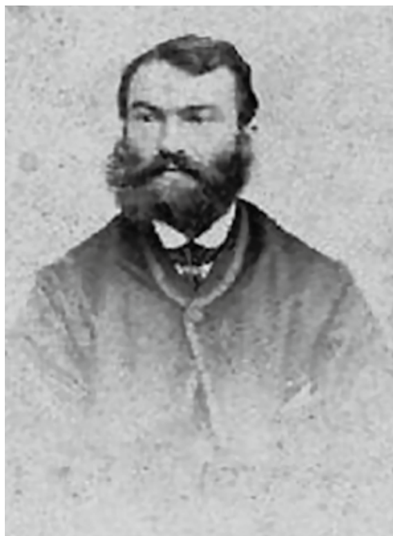
James Párkinson, quien dio nombre a una enfermedad que el mismo denominó en principio "parálisis agitante".

En la revista anterior, publicamos un a modo de cuento de una persona que, con párkinson, quiso compartir con todo nuestro público lector lo que siente con y desde su enfermedad. Nos habían llegado dos relatos, que son los que vamos a publicar pues no es este el espacio más propicio para todos ellos. Sin embargo sí nos ha parecido interesante mostrarlos como acercamiento a una enfermedad que cada vez oímos nombrar más pero de la que, sin embargo, desconocemos tanto. Por ello, antes de dar paso a este segundo relato, querríamos hacer un acercamiento a algunos de sus aspectos y de las consecuencias que traen consigo no sólo en las personas enfermas si no también en quienes las rodean en el día a día.