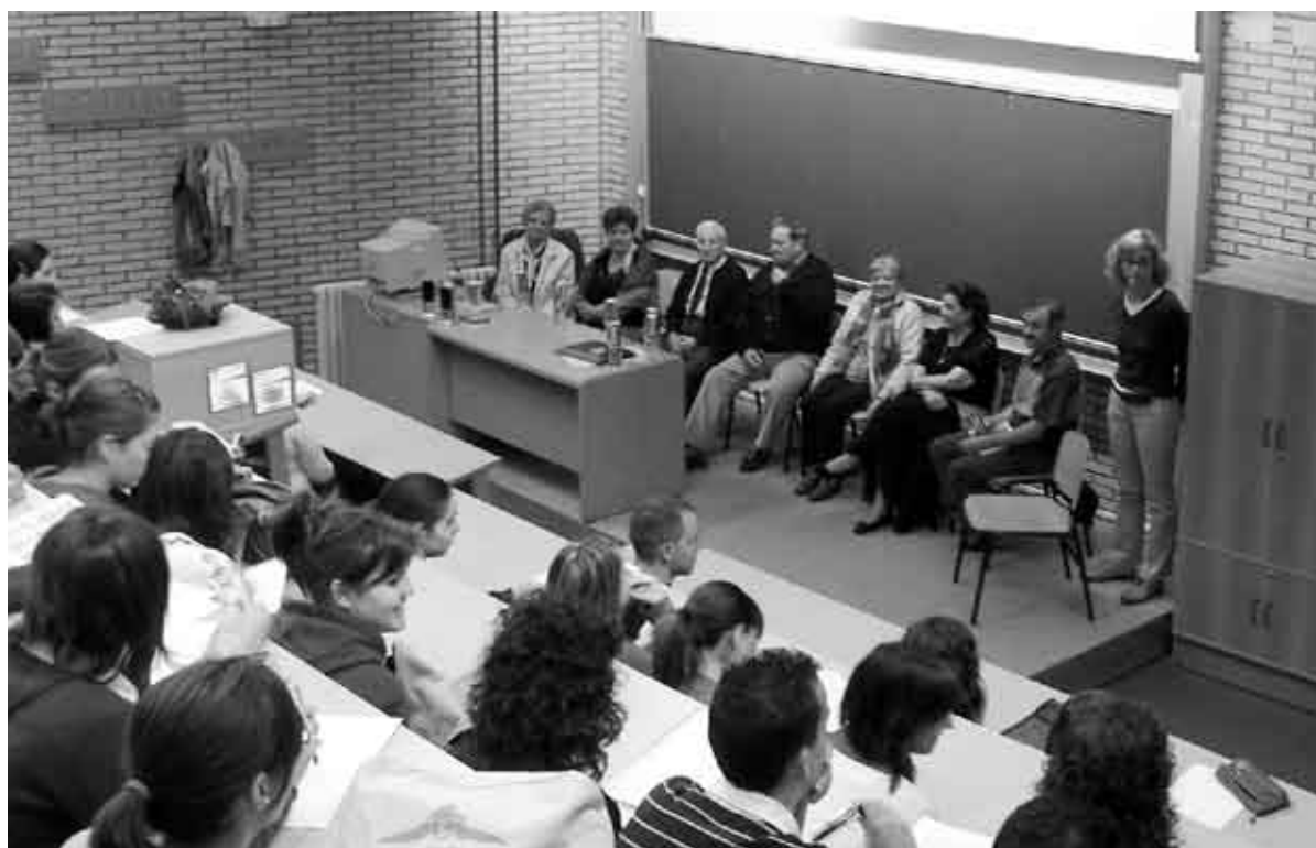
Clase de Economía Española y Mundial (Facultad de Ciencias Económicas y Empresariales)