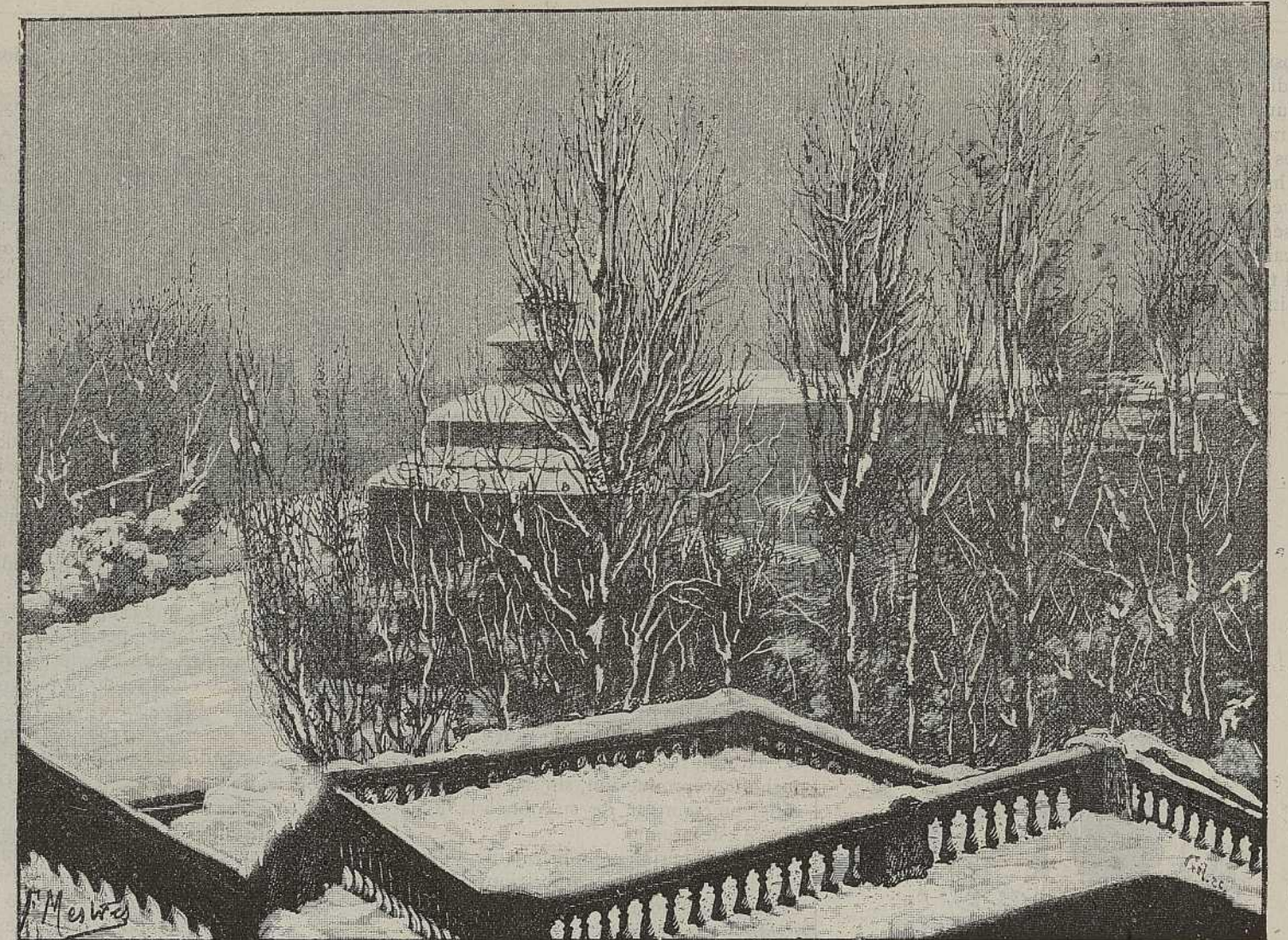
PAJARERA Y ESCALERA DE LA CASCADA

DURANTE la gran nevada de los días 10 y 11 de los corrientes