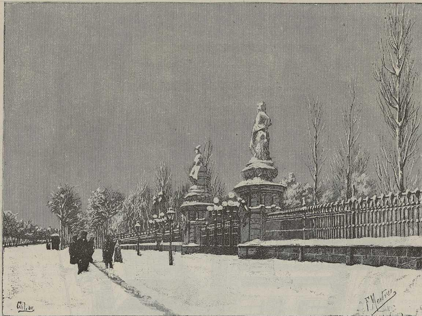
ENTRADA DEL PARQUE POR EL LADO DEL PASEO S. JUAN