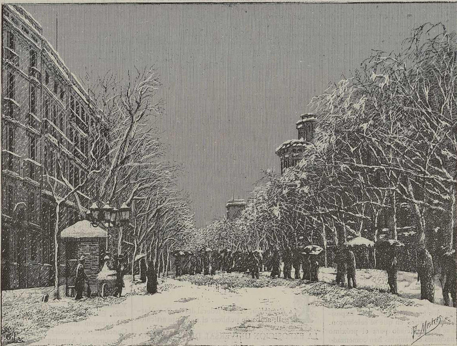
RAMBLA DE LOS ESTUDIOS