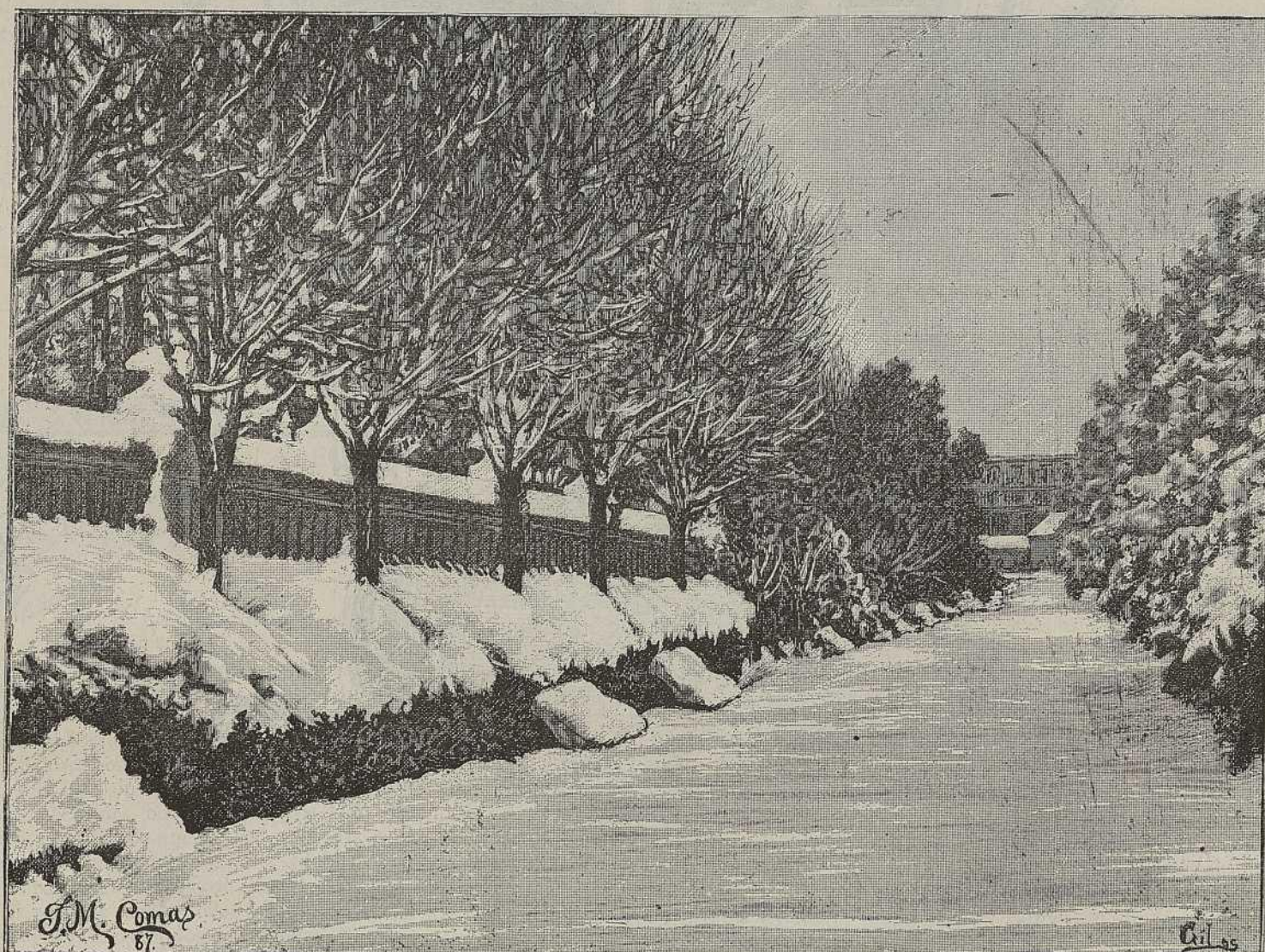
PASEO DE LAS MAGNOLIAS