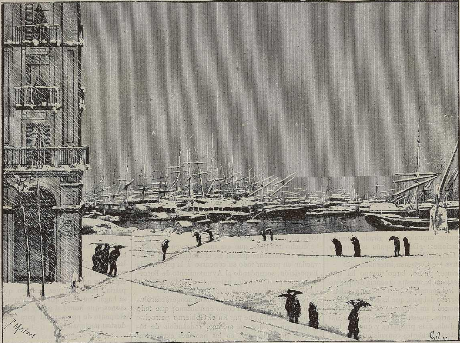
VISTA DE UNA PARTE DEL PUERTO (Tomada del natural)