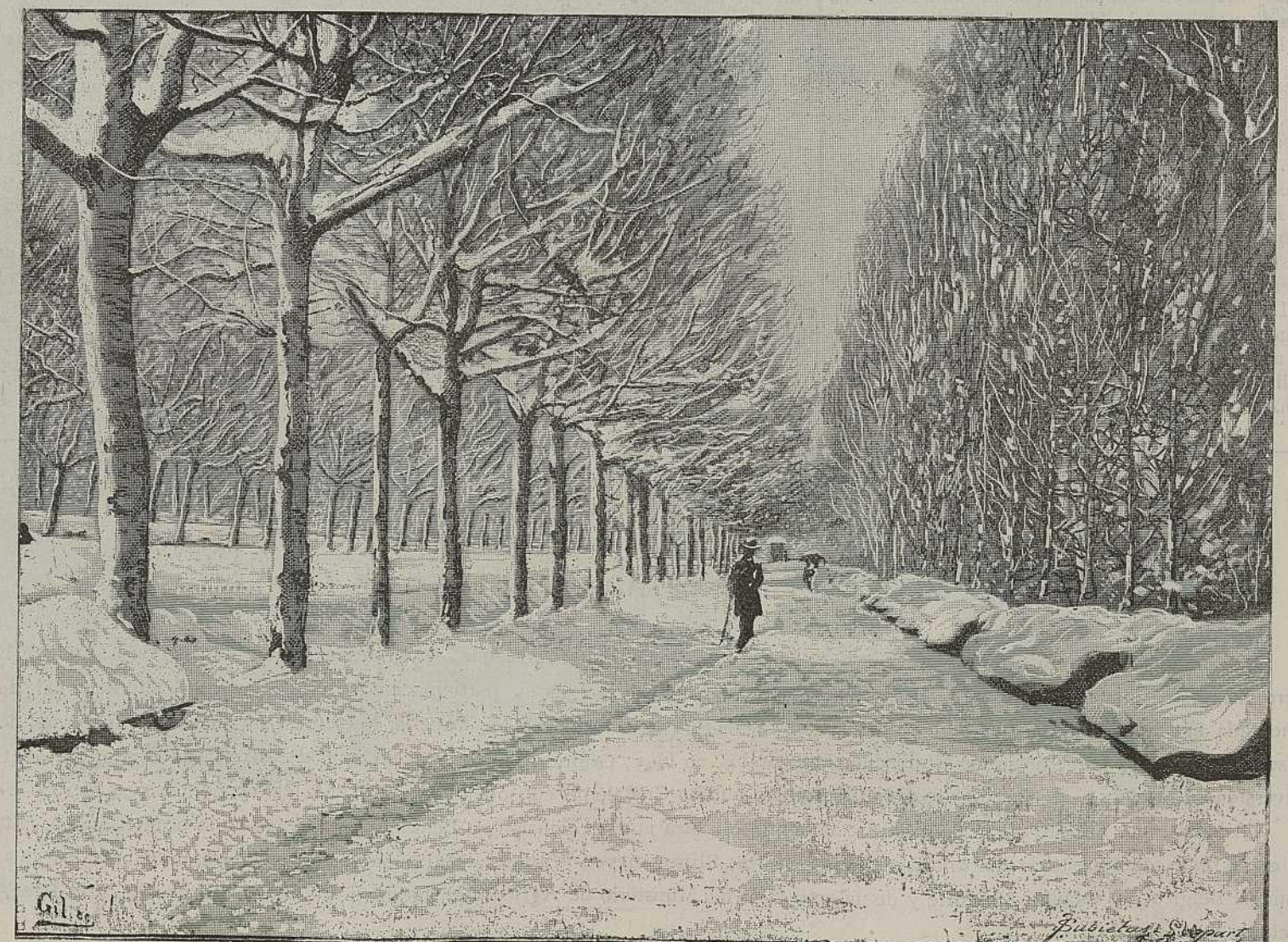
PASEO DE LOS ÁLAMOS