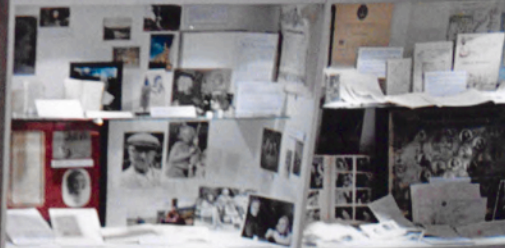
7 El aprendizaje de la vida