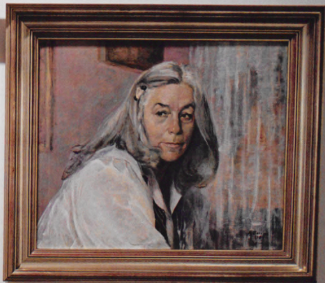
Portrait of a woman with white hair, 1965 Portrait of a woman with white hair, 1965