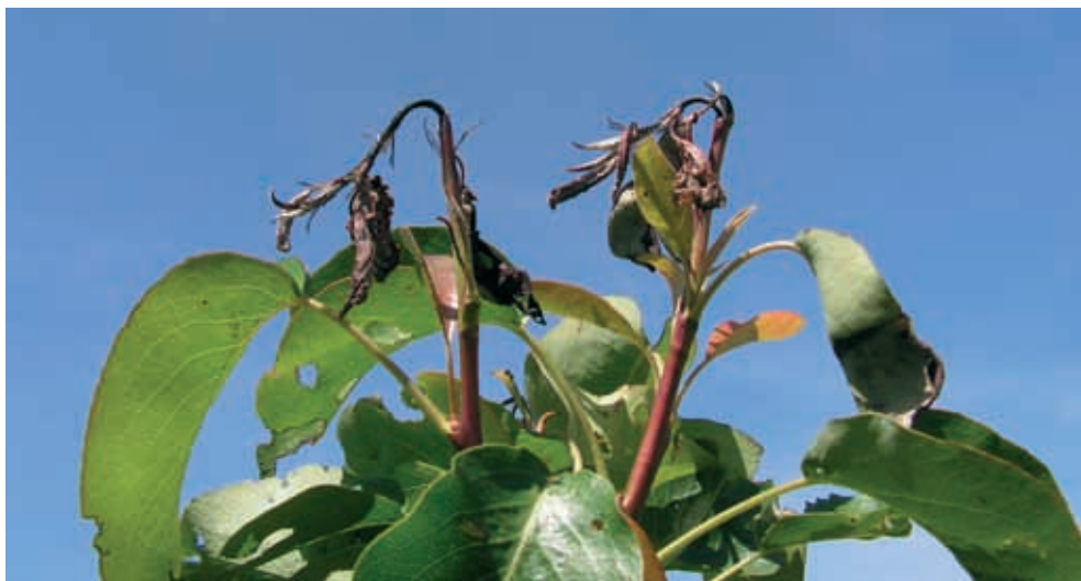
Síntomas en brotes (2)