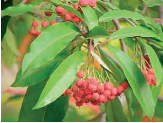
Fotinia davidiana (28)