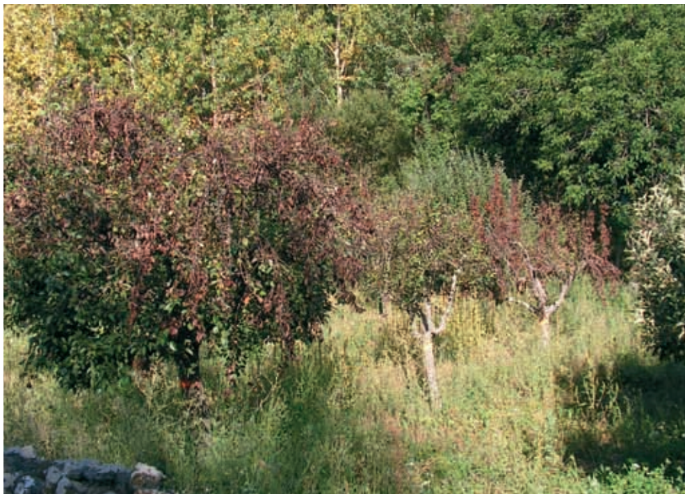
Síntomas en peral (10)

Los síntomas en rosáceas silvestres y ornamentales , huéspedes del fuego bacteriano, no son tan espectaculares como los observados en peral y en manzano. El reconocimiento de la enfermedad en estos huéspedes es muy importante porque pueden ser vehículo o reserva de la bacteria y contaminar plantaciones de frutales próximas.