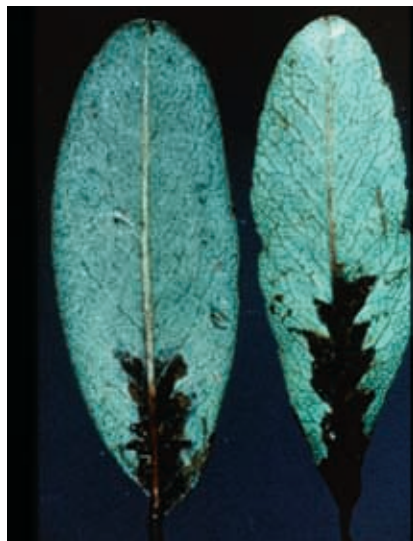
Sintomas en hojas (4) y (5)