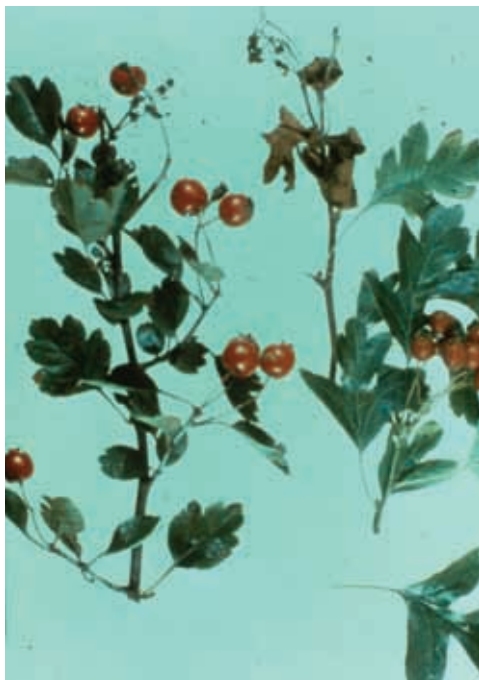
Síntomas en espino albar (40) y (41)