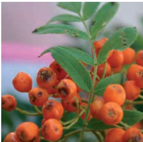
Síntomas en serbal de cazadores ( Sorbus aucuparia ) (20) y (21)