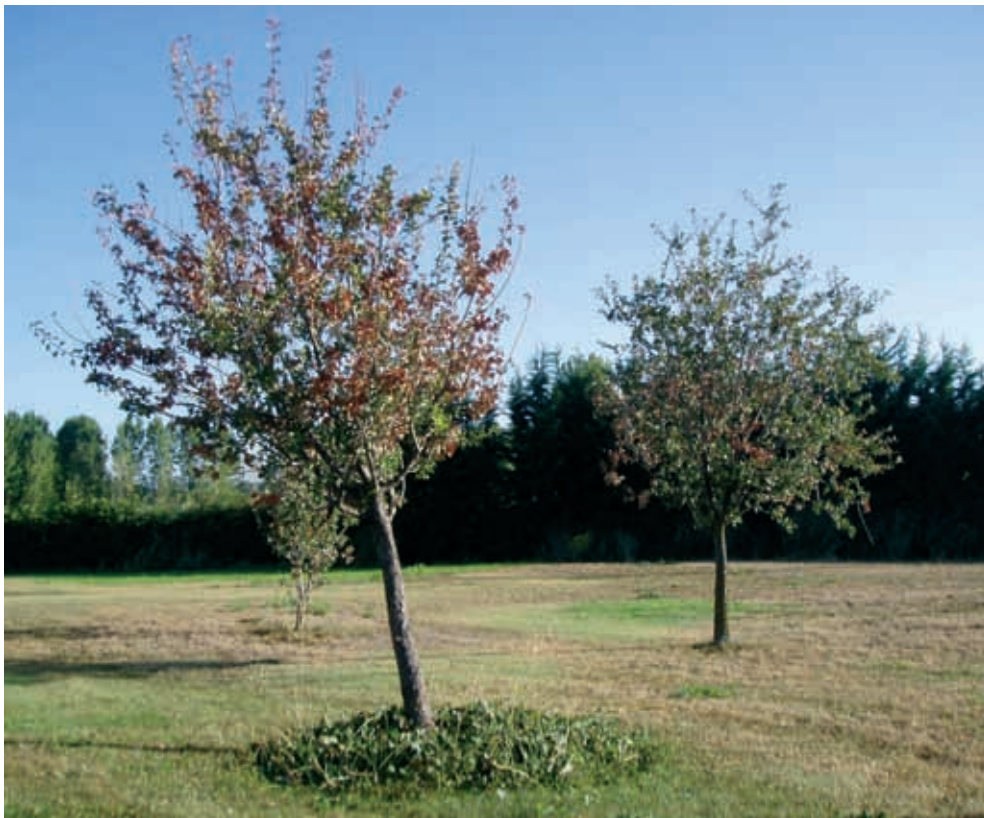
Aspecto general de árboles afectados (1)