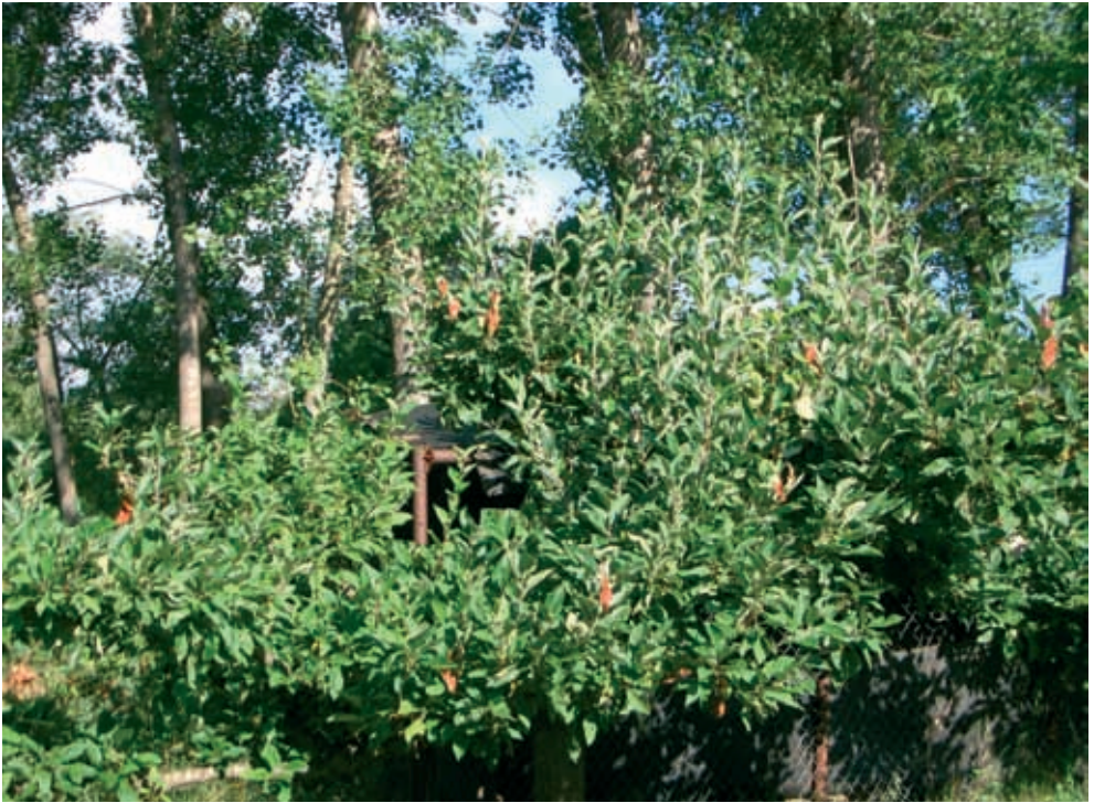
Síntomas en manzano (13)