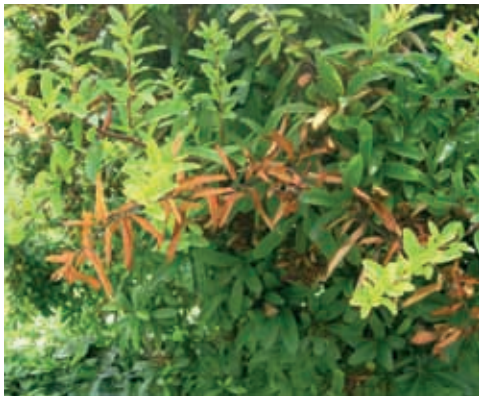
Síntomas en piracanta (35), (36) y (37)