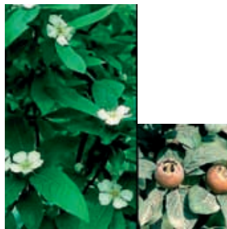
Nispero (32), (33) y (34)