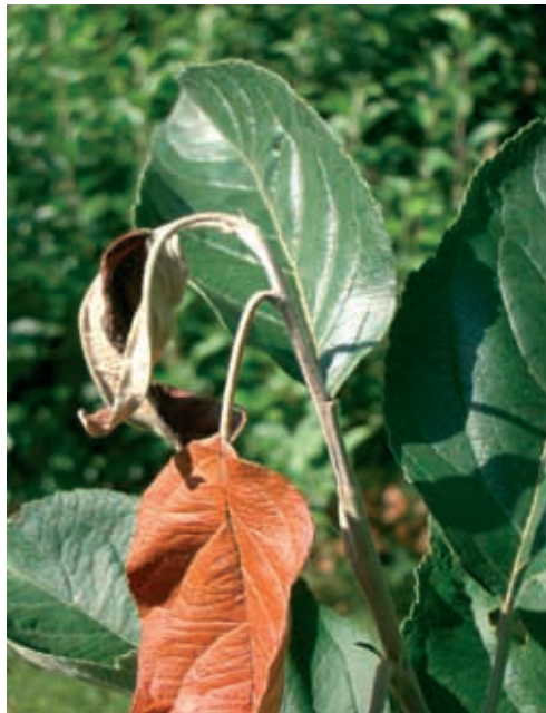
Síntomas en manzano (14)