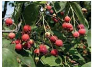
Amelanchier (29) y (30)