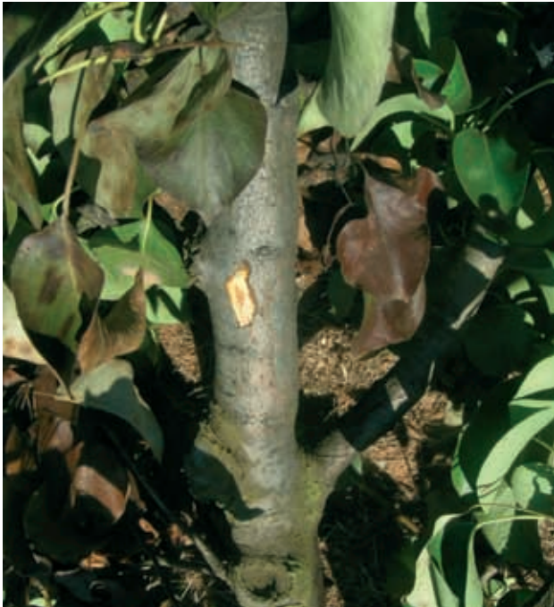
Sintomas en tronco (9)