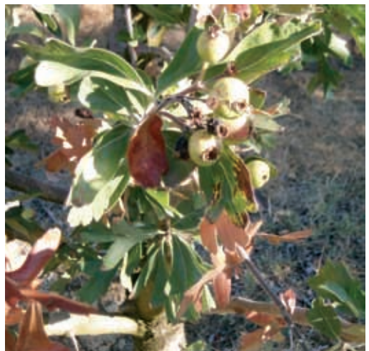
Síntomas en acerolo (25), (26) y (27)