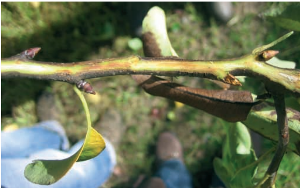
Síntomas en ramas (6)