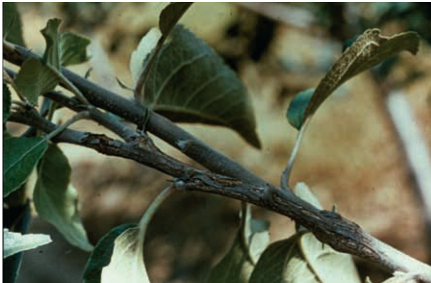
Nuevo brote a partir de uno afectado en una variedad de manzano poco sensible a la enfermedad (7)