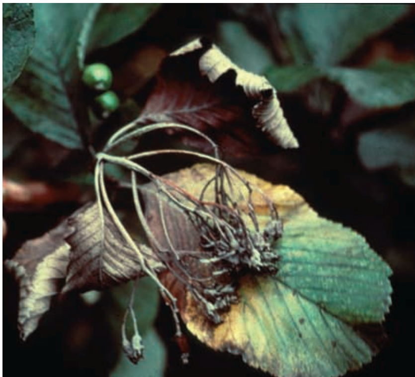
Síntomas en mostajo ( Sorbus aria ) (24)