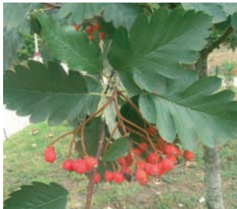
Mostajo ( Sorbus aria ) (22) y (23)