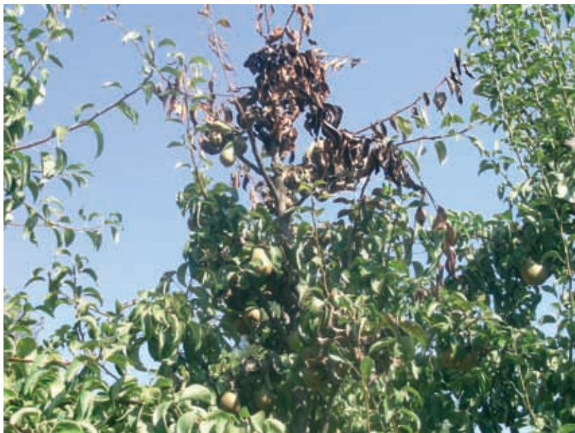
Síntomas en peral (11)