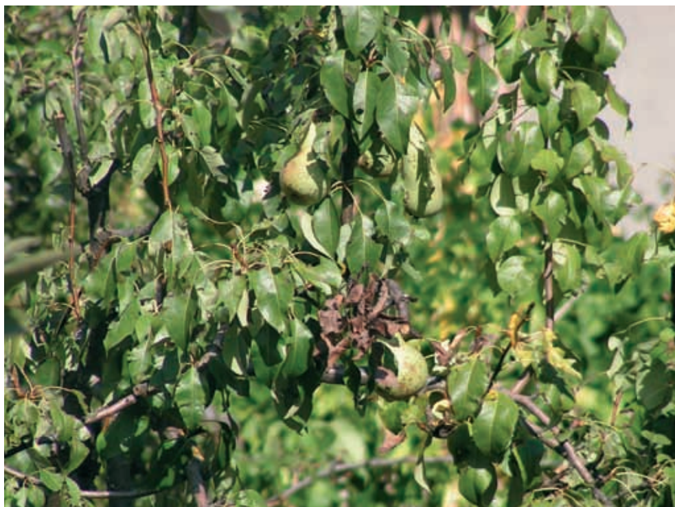
Síntomas en peral (12)