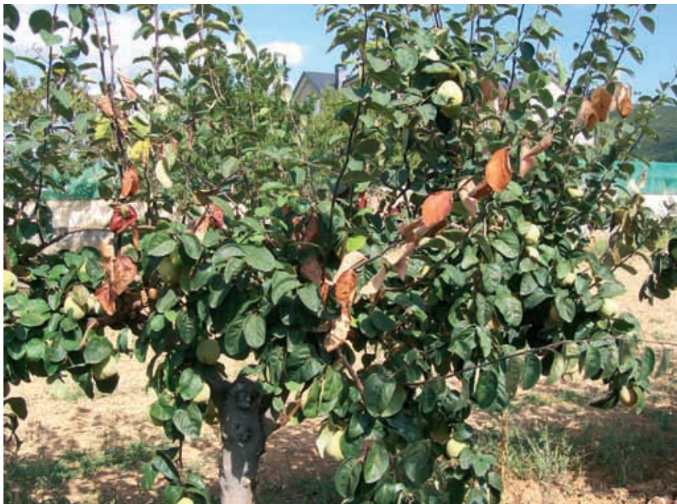
Sintomas en membrillero (16)