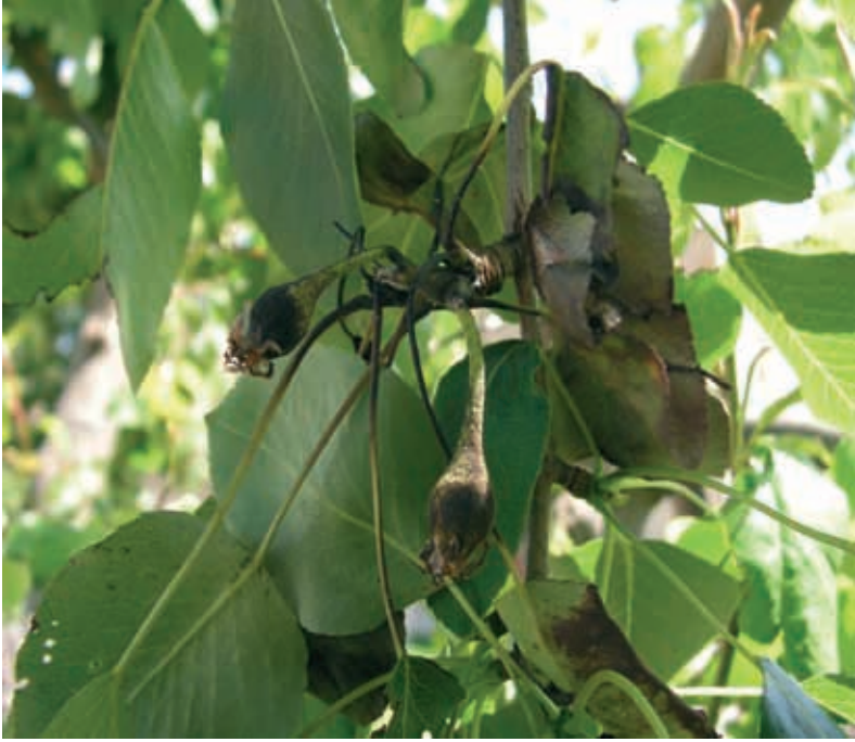
Sintomas en frutos (8)