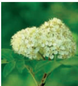
Serbal de cazadores ( Sorbus aucuparia ) (17), (18) y (19)