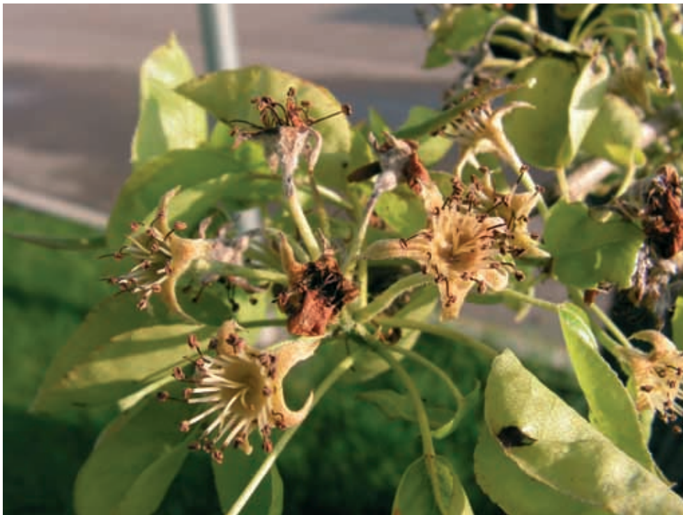
Sintomas en flores (3)