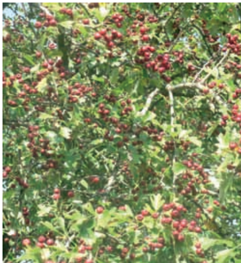
Espino albar (38) y (39)