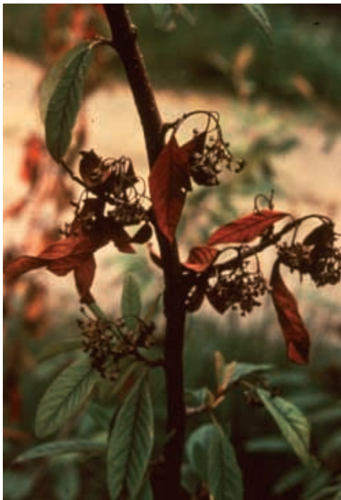
Síntomas en cotoneaster (45)