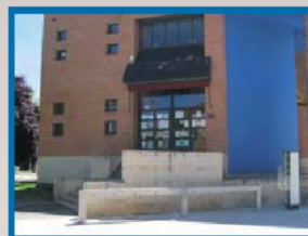
C.C. Cuatrovientos (Av. de Galicia)