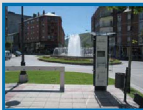
Flores del Sil (Av. La Martina)