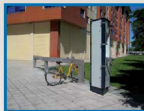
Av. de Valdés