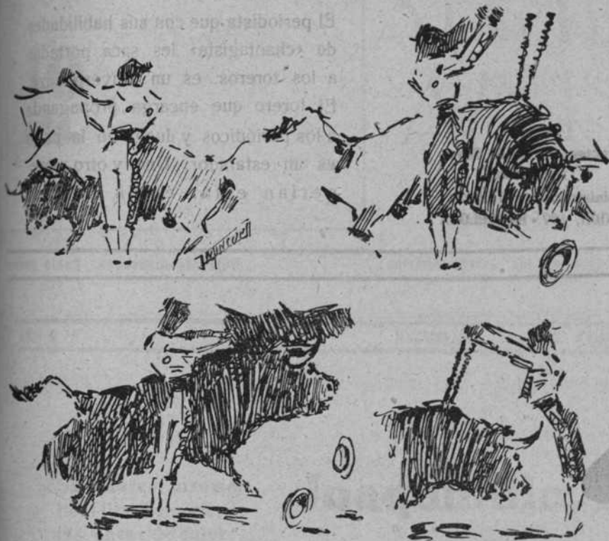
Las faenas de los "ases" del domingo vistas por un "espontáneo" del lápiz