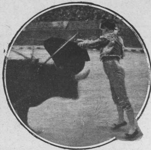
Varelito en Valencia el 7 de Abril.