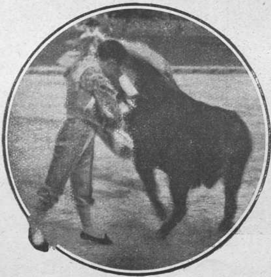
Dominguín en Valencia el 7 de Abril

Carnicerito fué ovacionado en su primero torea-