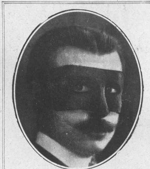
Zig-Zag. Otra incógnita que se descubrirá a medida que vayan apareciendo sus documentadas e interesantes revistas.