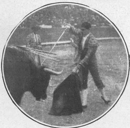
Lezcano en la misma corrida.