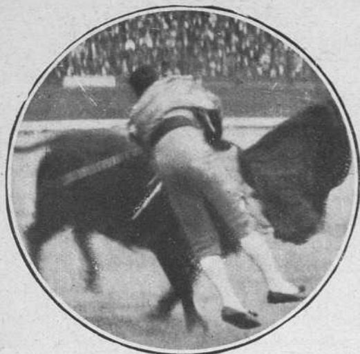
Serranito el 25 en Barcelona.