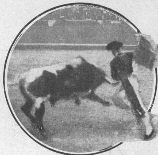
Camará en la misma corrida.

En el resto de la tarde y en los quites muy