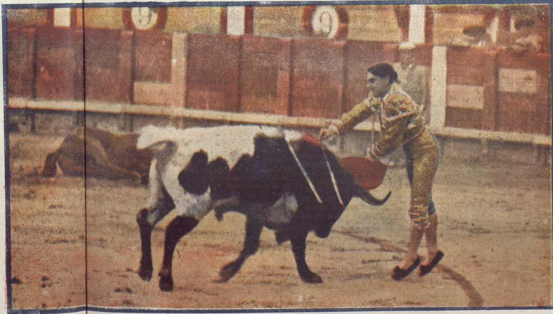
El diestro sevillano matando su primer toro en la misma fecha