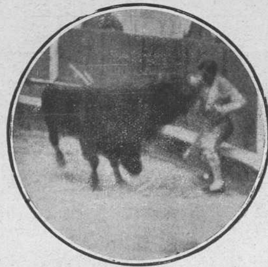
Joselito el 24 en Barcelona.

Con la muleta, solito, realizó una faena colosal. En el primer pase ayudado, con los pies juntos y estiradito, se ganó una ovación. Siguió con dos de pulso con la derecha, uno natural con la derecha, cambiándose la muleta de mano por la espalda y uno ayudado