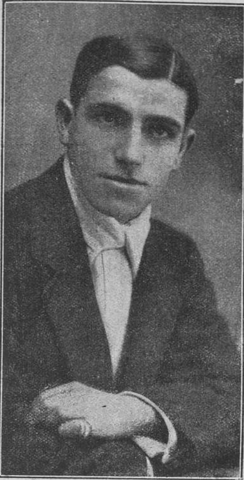
Juan Belmonte, que al fin se decide á emprender el viaje á Lima ante un monton de miles de duros, que marean bastante más que la travesía.