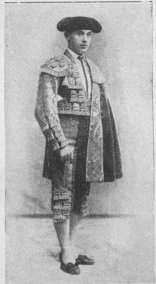
Diego Mazquiarán "Fortuna", que como Belmonte se decide á pasar el charco por la tentación de un buen contrato