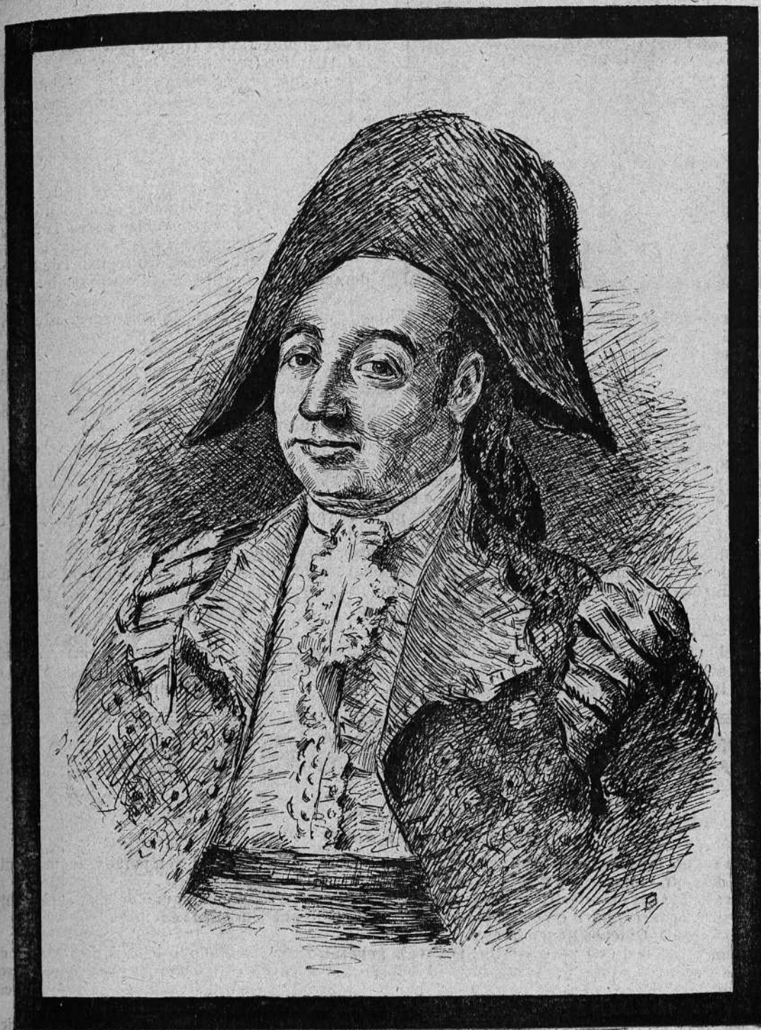
JOSE DELGADO GALVEZ (Hillo) (Muerto en Madrid el 11 de Mayo de 1804).