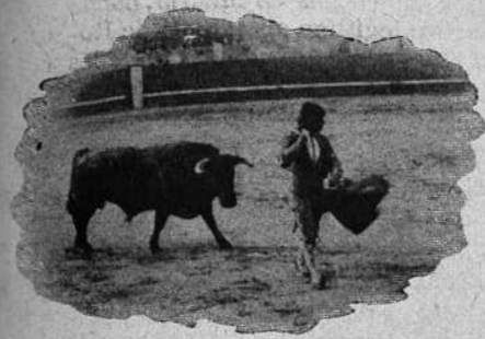
Guerra al terminar una larga

Antes de existir esta plaza, hubo sucesivamente otras tres más, erigidas en distintos puntos de Córdoba.