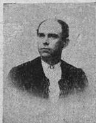
Rafael Guerra (Guerrita) 27 Septiembre 1887 Capuchinos, 10, Córdoba.