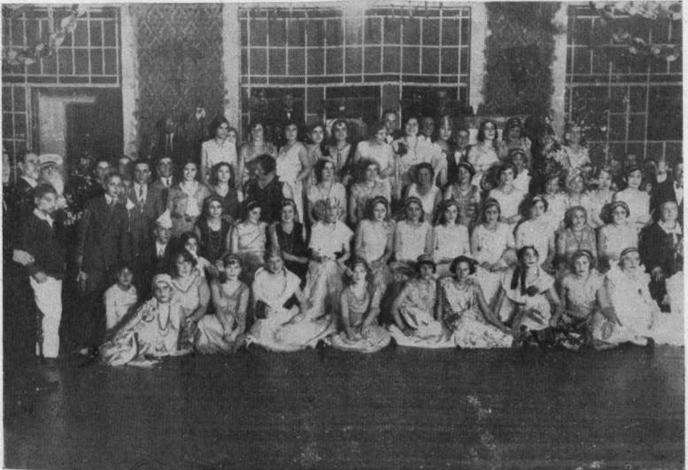
Hermosas señoritas asiduas concurrentes a nuestra casa, "en posse" para "Leon".