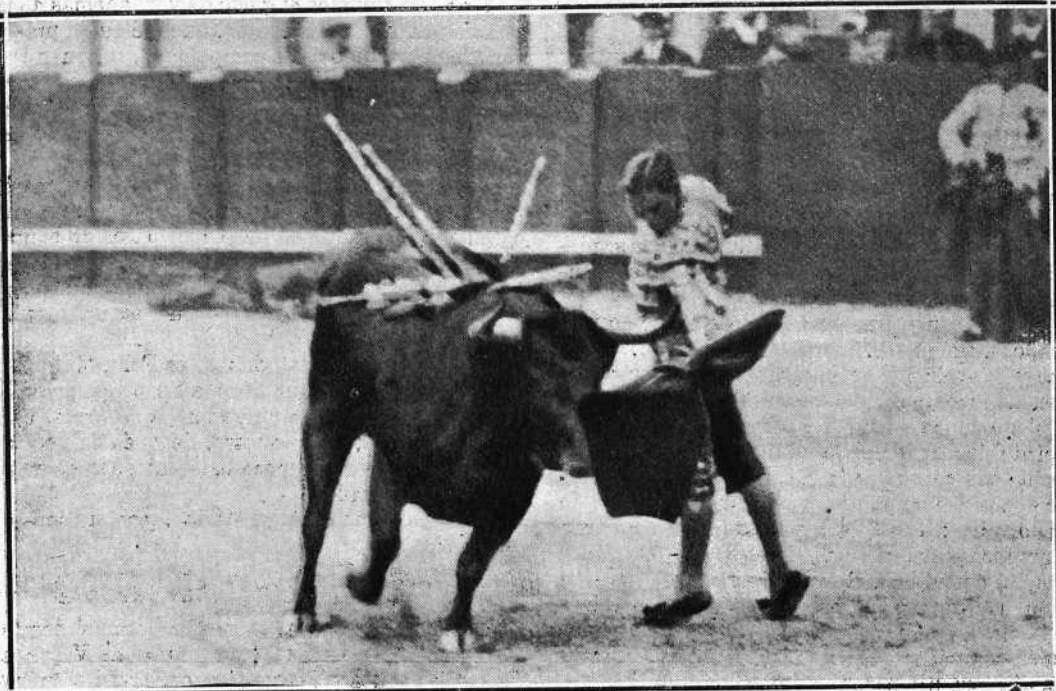
Madrid 25 Abril 1915.—Otro de los naturales que dió Juan Belmonte.