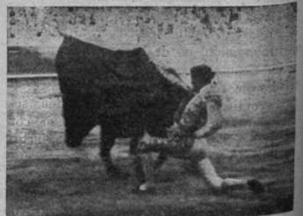
Lalanda en un pase de rodillas