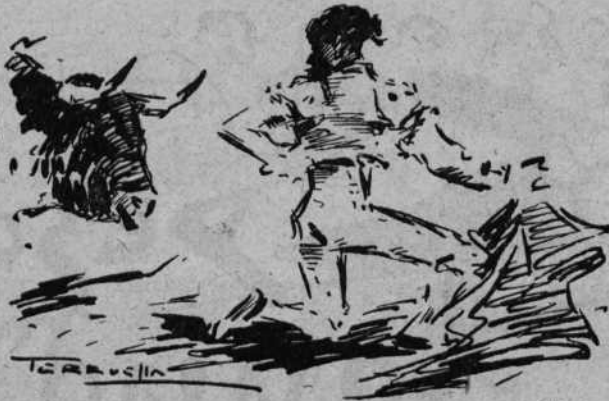
Belmonte rematando un quite

le hizo un faénón de dominio y adorno, como contestación sin chulerías, a algunos protestantes analfabetos en tauromaquia. Tuvieron estos que plegar velas y adherirse a la imponente ovación que cuajó al caer el toro tras unos pinchazos y media en su sitio.