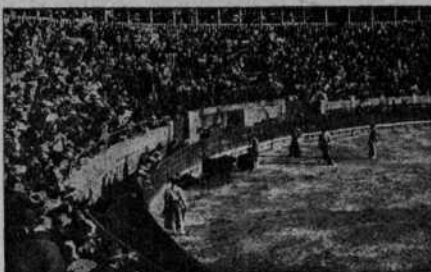
Interior de la misma en día de corrida

Las deficiencias de que adolecía antes en cuanto concierne a las dependencias auxiliares, han ido corrigiéndose paulatinamente hasta el extremo