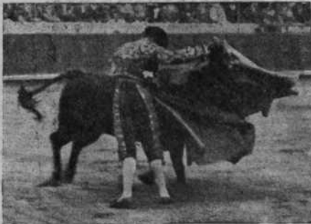
Juan Belmonte en una verónica