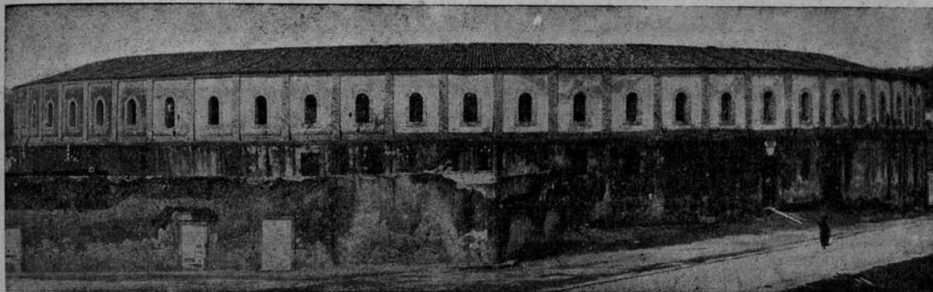
PLAZA DE TOROS DE PONTE VEDRA