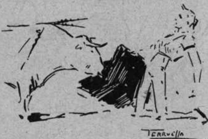
Marcial Lalanda en un desplante

toros, con valentía que no podemos negar aunque quizás le cuadre más el vocablo de temeridad. Fué aplaudido, así mismo en quites en los que si bien jugó los brazos, no hubo la alegría ni la variedad en ellos como esperábamos de quien se coloca ya como figurón indispensable de un gran cartel.