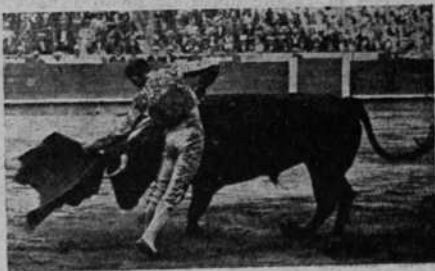
Lalanda ejecutando uno de sus inmensos naturales

Juan Belmonte, estuvo valentísimo, infatigable toda la tarde, cuidando de sus toros de una manera asombrosa, llevando la dirección de la lidia como pocas veces se ve hoy día. Haciendo quites oportunos y toreando de muleta como lo que es; el Unico. A su primero, le dominó por