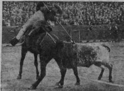
Una buena vara de Zurito