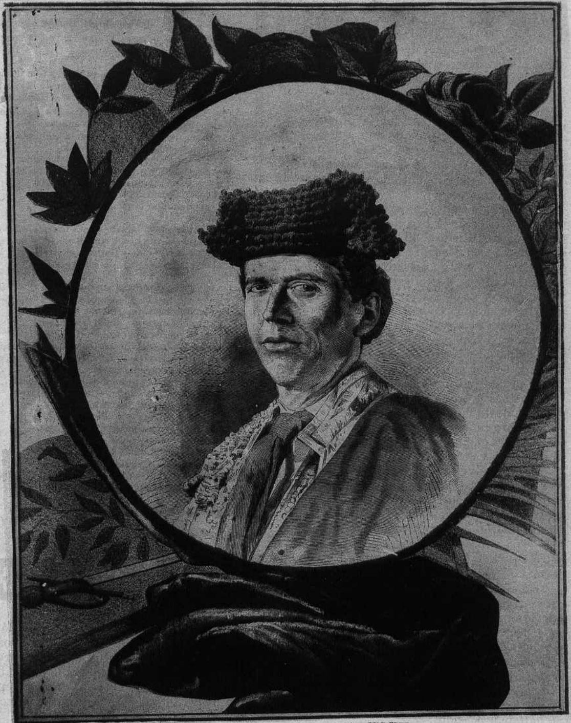
JOSÉ REDONDO (EL CHICLANERO)

Revista Semanal Ilustrada de Espectáculos