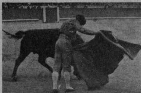
"Torerito de Málaga" veroniquando

La pluma retrocede ahora, cuando quiero forzarla a seguir el relato.