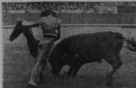
"Gitanillo de Triana" en una soberana verónica

Estuvo toda la tarde trabajador e incansable.