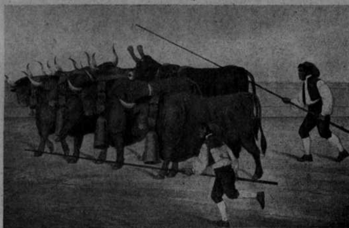
Conducción de un toro