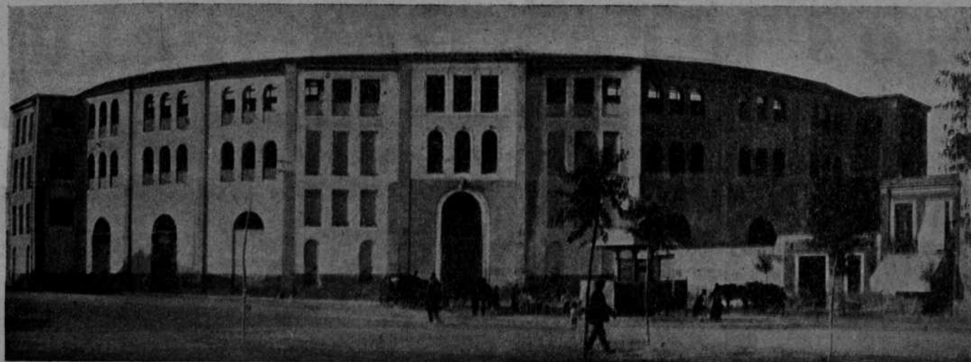
Plaza de Toros de Alicante